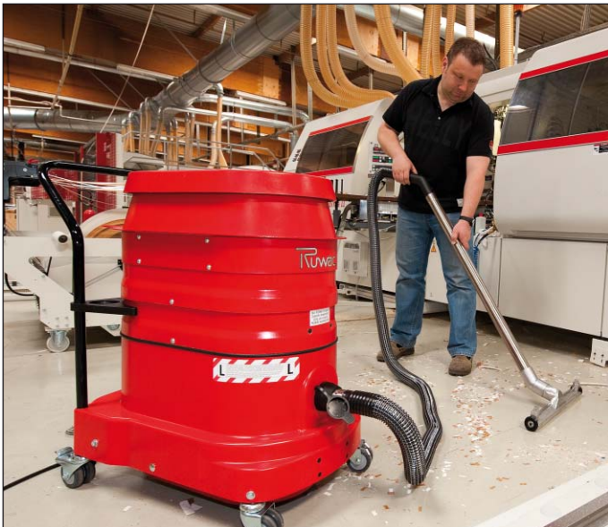
WSZ 2320 bij reiniging van vloeren