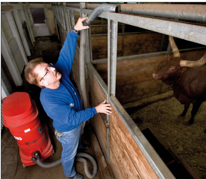
WS 2310, afzuiging van voorwerpen in de dierentuin