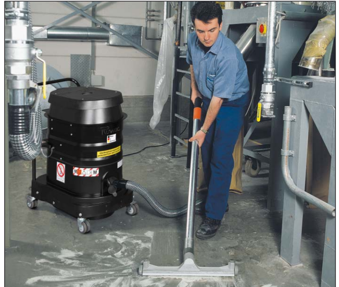
WS 2220, zone 22, in de chemische industrie