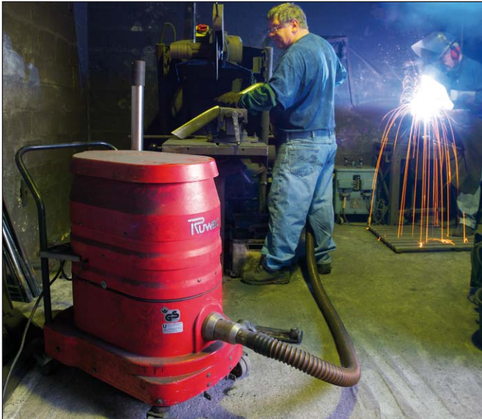
WS 2210 in de metaalverwerking