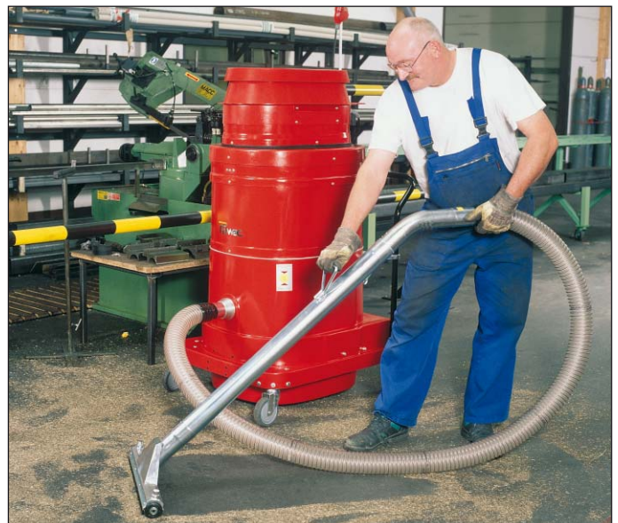
WS 3320, reiniging van vloeren, in de metaalindustrie