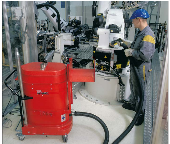
WS 2210 bij reiniging van machines